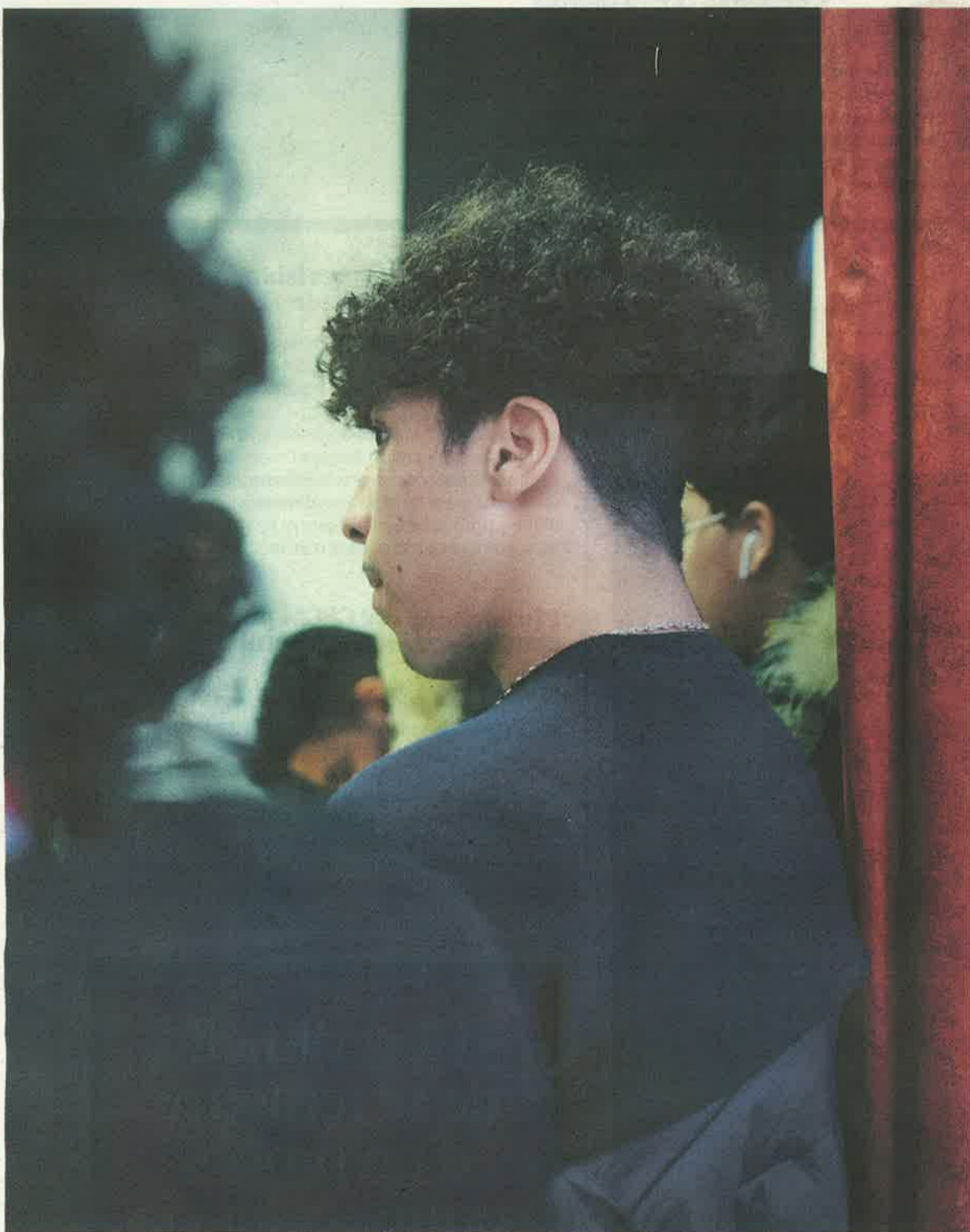
Au lycée Edgar-Quinet, dans le IX e arrondissement de Paris, le 13 mars.